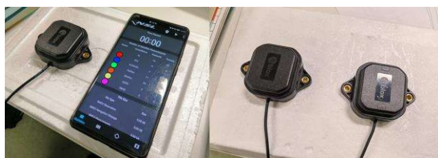
図 1 実験時のスマホやアンテナの位置

実験時の写真を図 1 に示した。2 つのアイテムを並べて発泡スチロールの土台に置き、手で目線の高さまで持ち、交差点で約 10 周歩いて (10~20 分)、データを取得した。左がスマートフォン、右が F9P 受信機対象の実験となる。