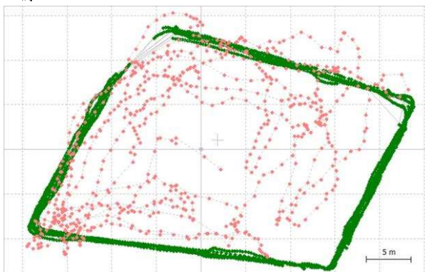
図 2 スマートフォン (赤) と RTK (緑) の結果例

1 江東区北砂 2 台東区柳橋 3 千代田区九段南 4 豊島区西池袋 3 丁目 5 江戸川区西小岩 6 江戸川区南小岩 7 墨田区東向島 8 杉並区宮前 9 杉並区上高井戸 10 渋谷区上原